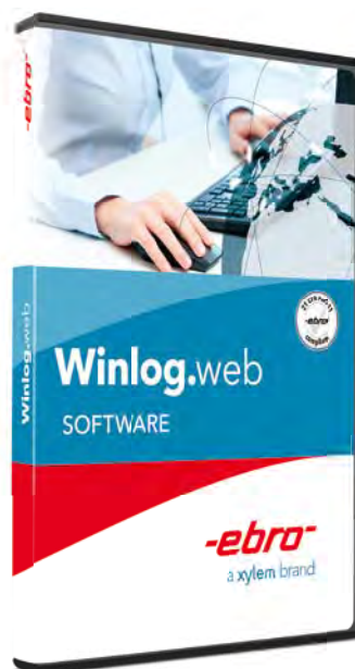
Winlog.web Logiciel d'analyse (version serveur internet)

Pour les utilisateurs du logiciel Winlog.web, ebro a développé une application - gratuite - nommée