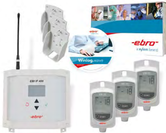
EBI 25-T-SET Kit d'enregistreurs de température sans fil (3 enregistreurs EBI 25-T, logiciel d'analyse Winlog.wave, interface, 3 supports muraux)

Vous trouverez le logiciel d'analyse pour les enregistreurs EBI 25 à partir de la page 84.