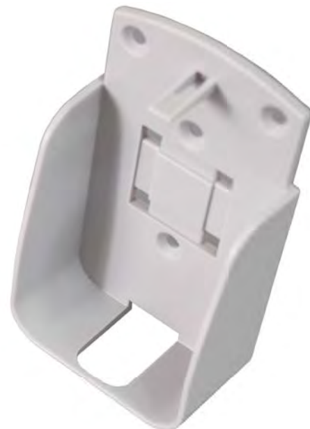
AG 152 Support mural pour EBI 25