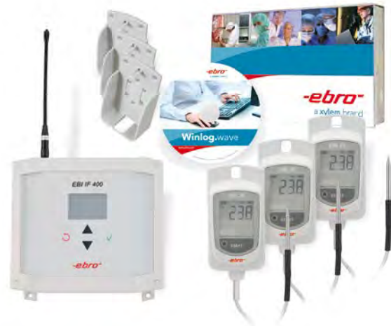
EBI 25-TE-SET Kit d'enregistreurs de température sans fil (3 enregistreurs EBI 25-TE, logiciel d'analyse Winlog.wave, interface, 3 supports muraux)