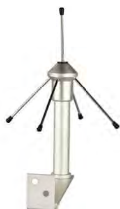
AL 116 Antenne externe pour l'interface EBI IF 400 afin d'augmenter la puissance d'émission (en option)

pour surveiller les performances depuis un smartphone.