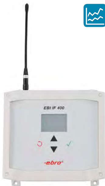
EBI IF 400 Interface avec antenne